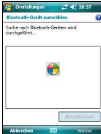
es wird gesucht...