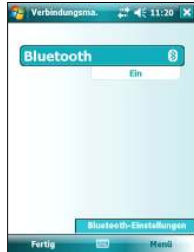
<Menü> + <Bluetooth-Einstellungen>