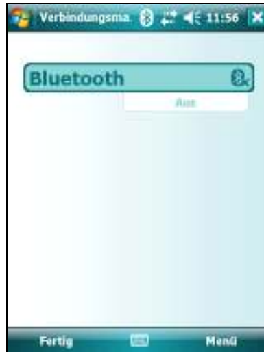
ggfs. mit <Bluetooth> einschalten