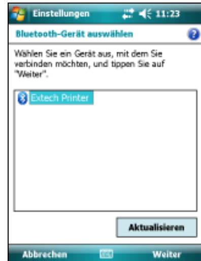
Drucker anwählen + <Weiter>